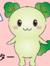
植竹小キャラクター「さいたん」

児童のあいさつが一層活発なものになるためのアイデアを、家庭・地域・学校それぞれの視点で考えました。