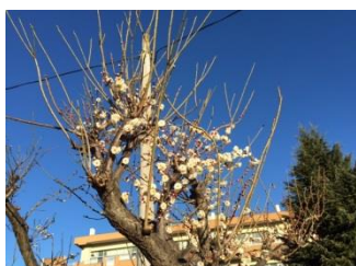
早くも花開いた校庭の梅の木

3学期がスタートして早1か月が過ぎようとしています。先月は寒波が押し寄せインフルエンザの流行も心配されましたが、数名の罹患でなんとか持ちこたえています。2月になると、「節分」「立春」と続き、暦の上では春となりますが、朝の寒さや冷え込みはまだまだ続きそうです。インフルエンザ流行のピークもこれからであり、本校ではまだまだ油断できないのが実情です。学校でも予防について対処、指導しますが、ご家庭でもご留意くださいますようお願いいたします。