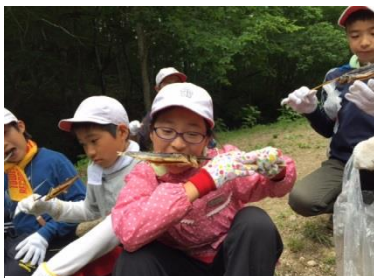
自ら捌いたイワナを食べる子たち

さて、《夏の思い出》で歌われている尾瀬、その福島県側入口「桧枝岐(ひのえまた)村」から直線で10kmほど手前に、館岩少年自然の家があります。6月16日(木)～18日(土)の3日間、本校の5年生が自然の教室に行ってきました。子どもたちが作ったスローガン「自然のきびしさ・豊かさに学び、みんなの絆を深めよう」のもと、全員が一生懸命に活動し、真剣な眼差しととびきりの笑顔があふれていました。キャンプファイヤーではダンスの終わりにアンコールの掛け声が起り、ロック・ソーラン節を館岩でも踊りました。